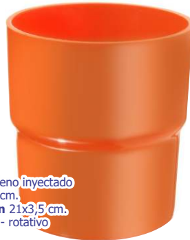
▶ VASO APILABLE G-115 si

material polipropileno inyectado tamaño Ø 7,5 x 8 cm. área de impresión 21x3,5 cm. impresión 1 color - rotativo