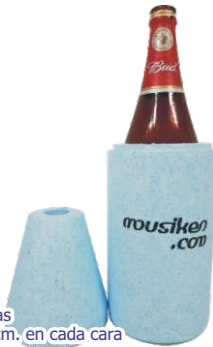
▶ PORTA BOTELLA TELGOPOR G-114 si

material telgopor impresión 1 tinta / 2 caras área de impresión 9x9 cm. en cada cara