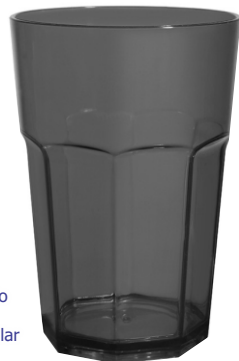
▶ VASO FACETADO 520 cm 3 . G-118 si

material SAM inyectado tamaño 520 cm 3 . impresión 1 tinta circular