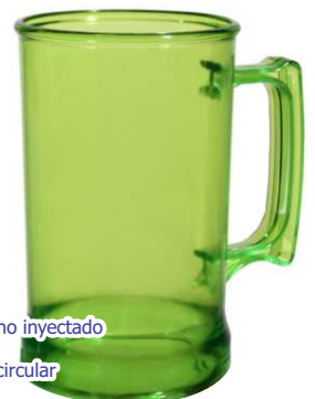
▶ JARRO CHOPP 400 cm 3 G-119 si

material poliestireno inyectado tamaño 400 cm 3 impresión 1 tinta circular