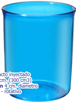
▶ VASO PLÁSTICO INYECTADO G-111 si

material alto impacto inyectado tamaño 7,2 x 9,5 cm. (300 cm 3 ) área de impresión 4 cm. diametro impresión 1 color - rotativo