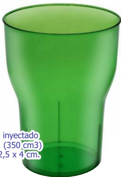
▶ VASO PINTA G-117 si

material poliestireno inyectado tamaño 8 x 10,5 cm. (350 cm 3 ) área de impresión 2,5 x 4 cm. impresión 1 tinta