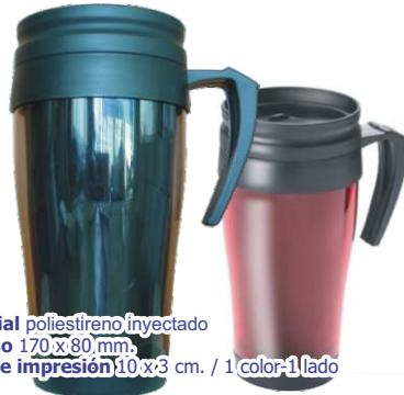
▶ JARRO TERMICO G-112 si

material poliestireno inyectado tamaño 170 x 80 mm. área de impresión 10 x 3 cm. / 1 color - 1 lado