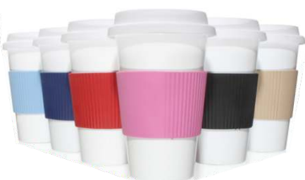
▶ VASO CAFE TERMICO CON GRIP G-150 si

material polipropileno tamaño Ø 9 x 14,5 cm. área de impresión 13 x 18 cm. impresión no contiene