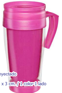
▶ JARRO TERMICO COLORES FUERTES G-113 si

material poliestireno inyectado tamaño 170 x 80 mm. área de impresión 10 x 3 cm. / 1 color - 1 lado