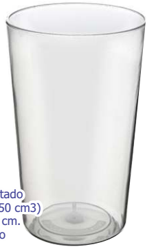
▶ VASO GOURMET G-110 si

material poliestireno inyectado tamaño Ø 7 x 11,5 cm. (350 cm 3 ) área de impresión 21x11 cm. impresión 1 color - rotativo