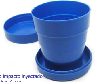
▶ VASO PLÁSTICO PLEGABLE G-116 si

material alto impacto inyectado tamaño Ø 5,5 x 7 cm. área de impresión Ø 4,5 cm impresión 1 color en la tapa