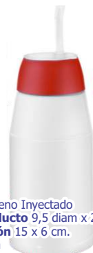
▶ TERMO MATE G-152 si

material Poliestireno Inyectado tamaño del producto 9,5 diam x 26 al cm. área de impresión 15 x 6 cm. impresión 1 tinta