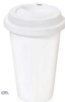
▶ VASO CAFE TERMICO G-151 si

material polipropileno tamaño Ø 9 x 14,5 cm. área de impresión 4 x 4 cm. impresión 1 tinta