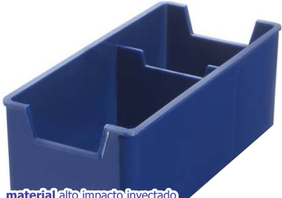
▶ AZUCARERO CON PORTA EDULCORANTE G-108 si

material alto impacto inyectado tamaño 13 x 5 x 6 cm. área de impresión 12 x 4 cm impresión 1 color - 2 lados